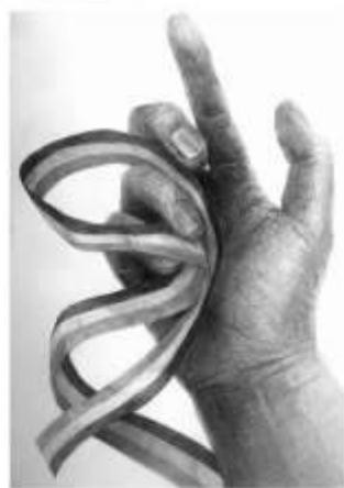
静物デッサン・人物デッサン・構成デッサン