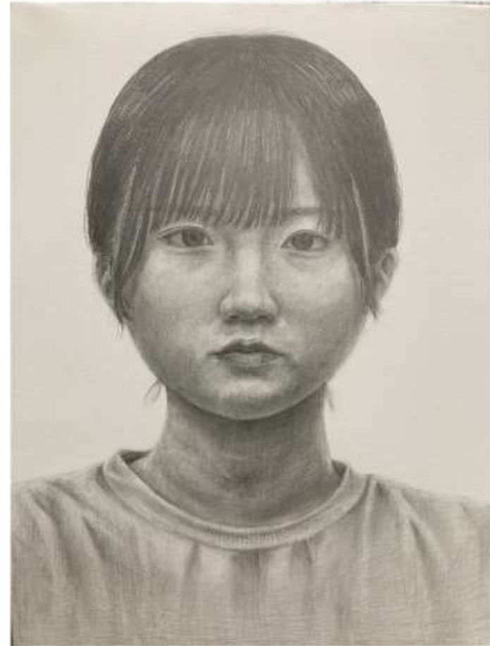
◆ 自画像 木炭紙大 制作時間 12時間 2023.6