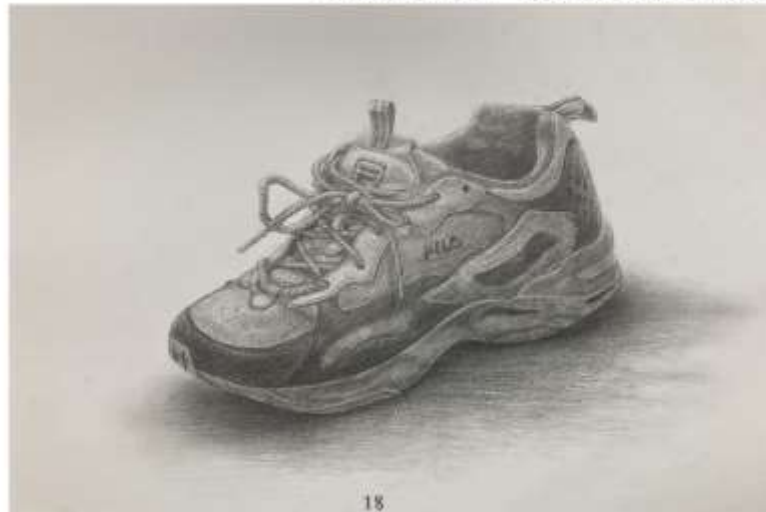
↓ ◆ 細密デッサン B3 制作時間 12時間 2023.3