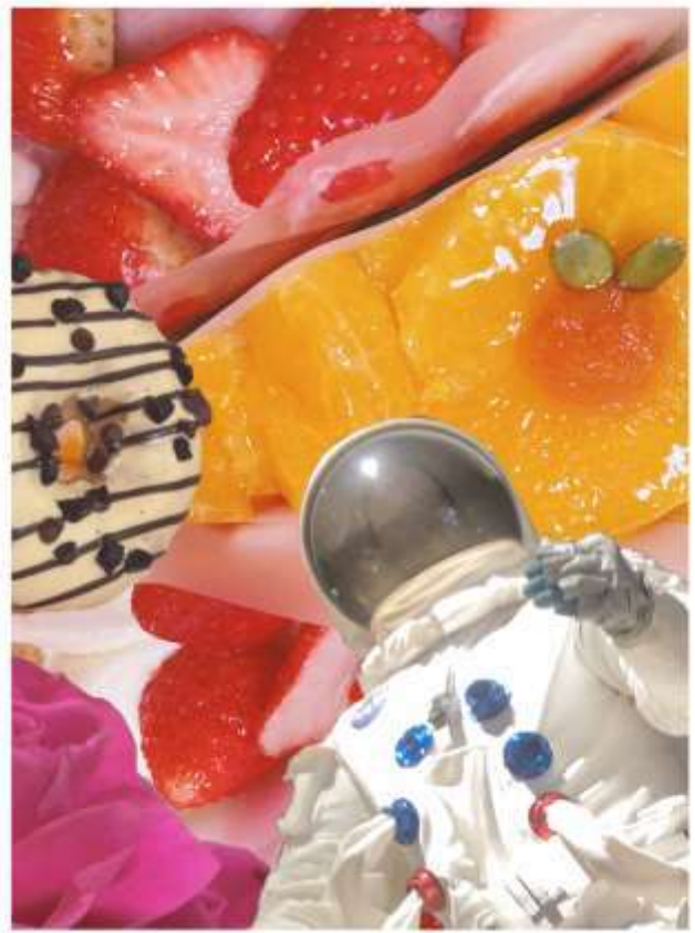
◆ 制作時間 20時間 使用ソフト ibisPaintX 使用画材 アクリルカラー 2023.7 この作品のテーマは「好きなもの」です。デジタルでコラージュをした後アナログで再構成しました。特に質感の違いを表現することに力を入れて制作しました。