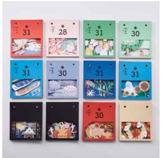
視覚デザイン専攻 タイトル：重ねる切り絵暦「るいるい」