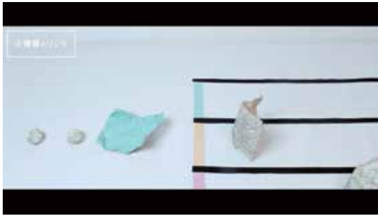
映像デザイン専攻 タイトル：SLEEPING FACTORY