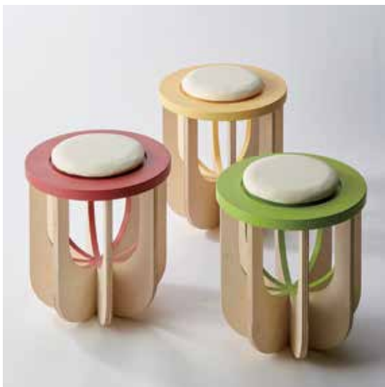
工業デザイン専攻 タイトル：Basket Stool ～ゆらゆら揺れるフルーツバスケットの ような木製スツール～