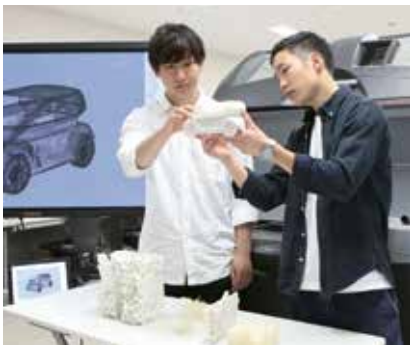
工科大のリメディアル教育では、平面・立体の実技課題のほか、英語課題も用意されている。

国際的なやり取りを前提とした、英語によるデザイン課題の一例。語学力の必要性を認識させながら、デザイナーとして必要な考え方、姿勢を学んでもらう。