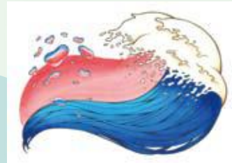
東京藝術大学 工芸科 合格者作品 (入試再現)