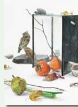
東京藝術大学 絵画科日本画専攻 合格者作品

東京藝術大学、武蔵野美術大学、多摩美術大学は令和の時代を迎えてもまだまだ倍率も高く、しっかりとした実技錬成が必要です。ハイレベルな指導と、ハイレベルな作品に触れる中で、この夏自分の限界に挑戦してみましょう。