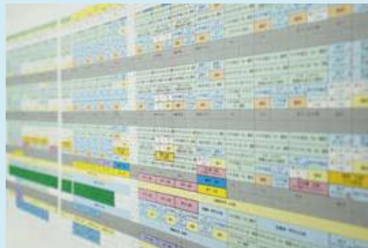
個別カリキュラム

藝大、多摩美、武蔵美は出題が似ているため対策に大差は生じませんが、下記の大学は個々で出題内容が大きく変わるため併願校の絞り込みを行い、対策する実技の種類を増やさないと工夫も求められます。効率の良いカリキュラム作成が重要なポイントです。